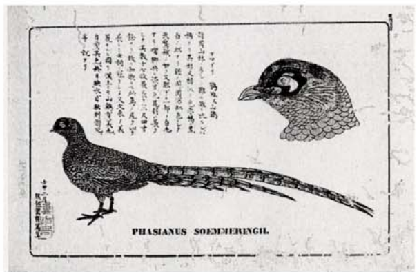
動物図 ヤマドリ 文部省 服部雪斎画 木版色刷 21×32cm 明治5年

もので、植物関係5図、動物関係5図からなり、銅版印刷によって製作されています。植物の分野は小野職愨、動物分野は田中芳男の選により、校閲者には久保弘道、榊原芳野、最上孝吉らがあたり、図は加藤竹斎、長谷川竹葉、服部雪斎が担当しています。