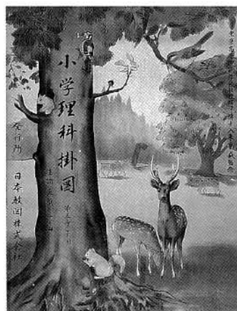
小学理科掛図 第五学年用 前編 昭和26（1951）年