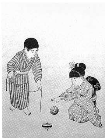
尋常国語教科書掛図 前編 明治35（1902）年