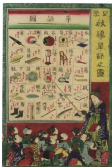
おもちゃ絵 児学教導單語之図 木版色刷 35.3×23.7cm 明治8(1875)年

絵双六は、大きく分けるとおもちゃ絵の一種とも考えられますが、おもちゃ絵と違って細工や切り抜いたりせずに、そ