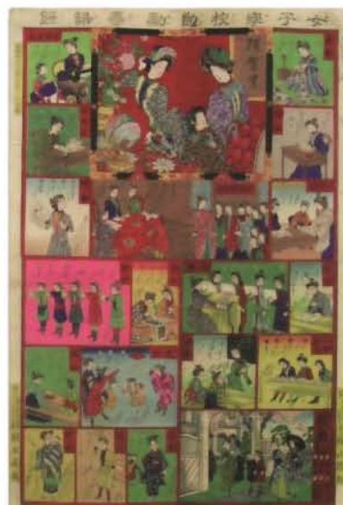
女子学校勉強 すごろく 寿語録 橋本周延画 木版色刷 72.8×49.1cm 明治20（1887）年