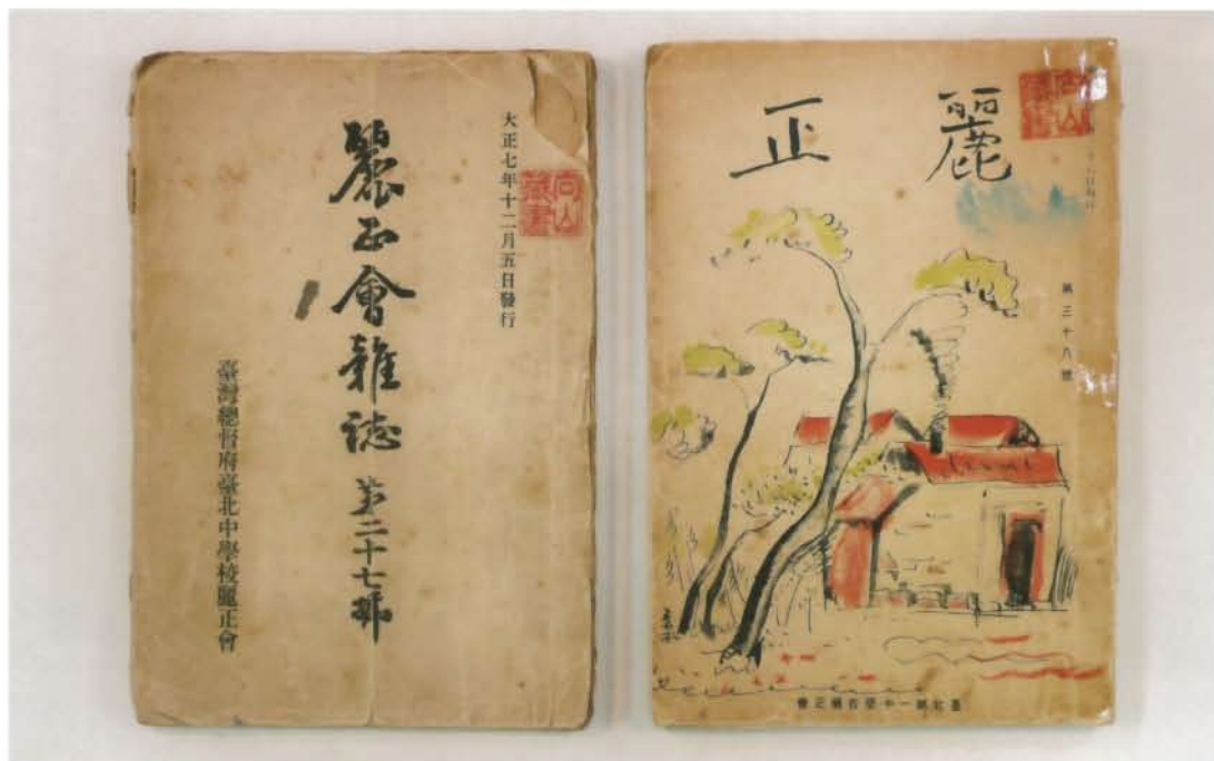
(左)『麗正会雑誌』第27号 大正7 (1918) 年12月 21.9×15.0cm