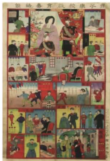
男子学校教育 すごろく 寿語録 楊斎延一画 木版色刷 72.6×48.8cm 明治23（1890）年

おもちゃ絵とは簡単にいえば、子ども用錦絵であり、一枚摺り・多色刷り木版画として明治期には大いに流行しました。その種類は多様で、着せ替え絵、組上げ・組立て絵、回り灯籠、紙相撲、メンコ、カルタ、絵合