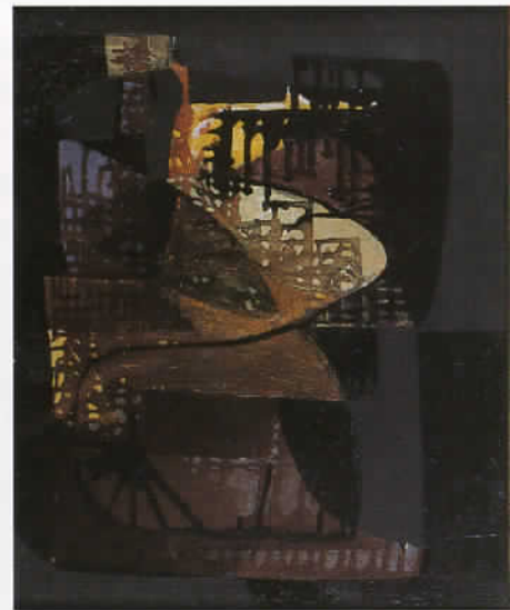
コンポジション アルベルト・ブーリ キャンバスに油彩 1950年