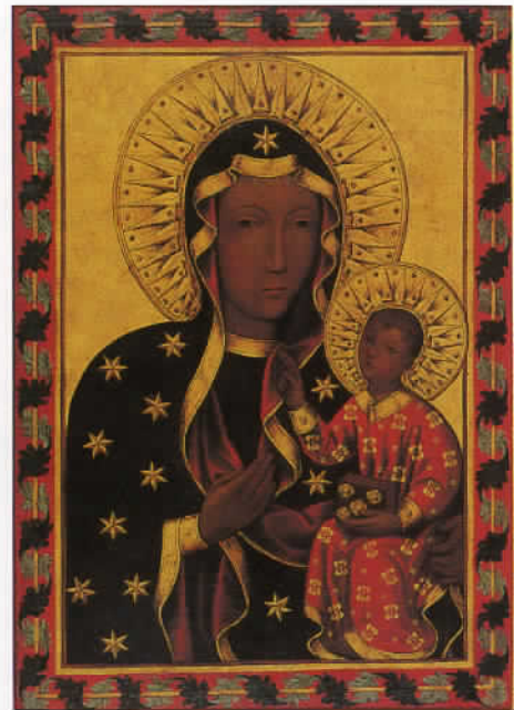
聖母子像 シエナ派 キャンバスに油彩 15世紀