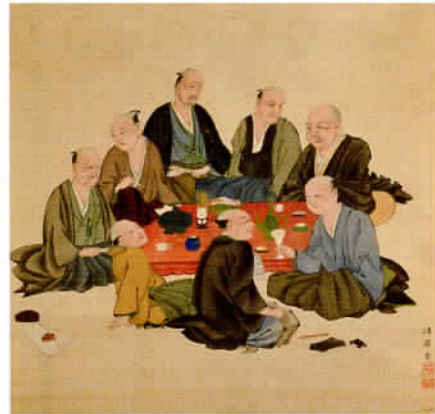
雨宮章廸画 譚園諸彦会譚図 18世紀後半か