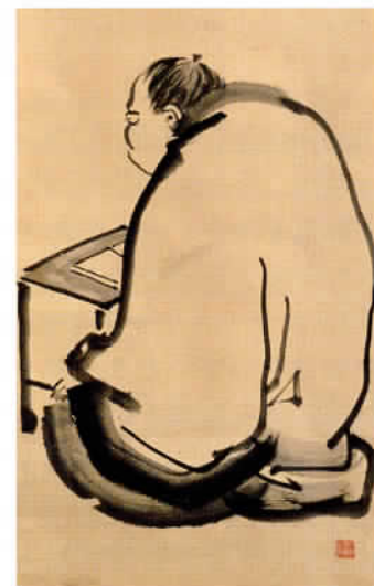
中井藍江画 中井竹山像 1803年頃