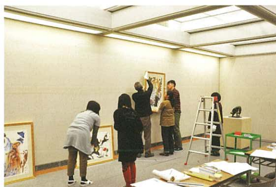
美術資料の模擬展示

2016年2月7日から12日まで、本学通信教育部の「学芸員スクーリング」が開講され、合計41名が受講しました。実習生たちは、資料の取り扱い方法、当館の展示室での模擬展示等の実技や博物館における各種実務について、熱心に受講していました。