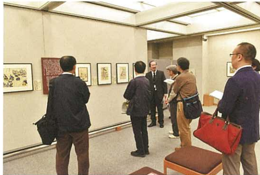
ギャラリートーク（11月13日）

2015年11月2日から12月19日まで、「ミュージアム・コレクション展2015 錦絵にみる子供の遊び」を開催しました。会期中819名の入館者がありました。