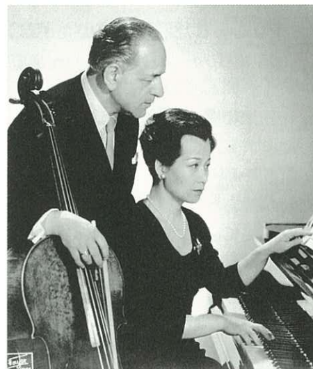
ガスパール・カサドと原智恵子

楽譜（出版譜・手稿譜）／演奏会プログラム・ポスター／演奏レコード／図書／雑誌／ガスパール・カサド・コンクール（フィレンツェ）資料／手紙／写真／原智恵子愛奏のピアノ／勲記 など