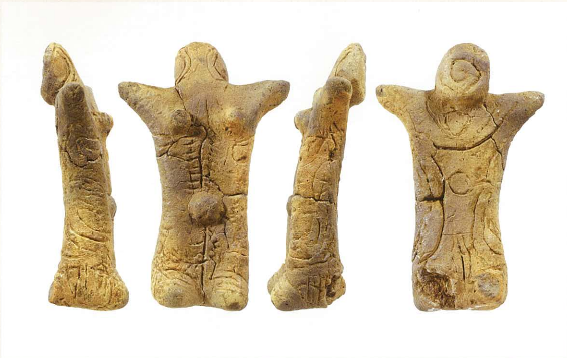
左側面・表面・右側面・裏面