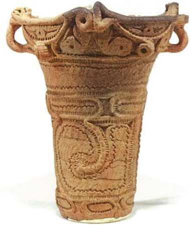
御嶽堂遺跡 A 地点包含層出土深鉢 縄文時代中期（新道式） 高 24.6cm

この度、当時の関係者の協力を得て田端・御嶽堂両遺跡の調査資料の再整理を行い、発掘調査報告書を刊行することができました。これを記念して、両遺跡の出土品の公開を中心に、調査を担当した玉川学園考古学研究会の活動の軌跡をたどり、さらに玉川学園における考古学研究の歩みや、研究会を生み出した自由研究での取り組みも紹介します。