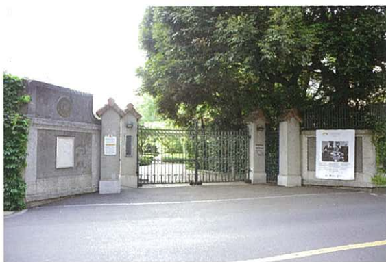
スペイン大使館 正面入口

展示会の初日には、スペインのチェリスト、アルド・マータ氏によるチェロコンサートが行われました。その後のレセプションでは、ゴンサロ・デ・ベニート・セカデス駐日スペイン大使と、本学の小原芳明学長がスピーチをされ、日本とスペインの今後の友好関係のますますの発展を願われました。11日間の会期中の来場者は、268名でした。