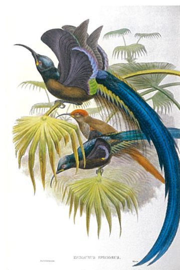
オナガカマハシフウチョウ 『ニューギニア鳥類図譜』より