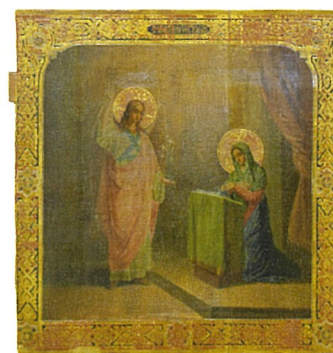
ロシア・アイコン「受胎告知」