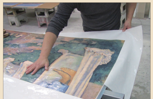
Stick a transfer paper onto ceramic board. 陶板に転写紙を貼付ける。