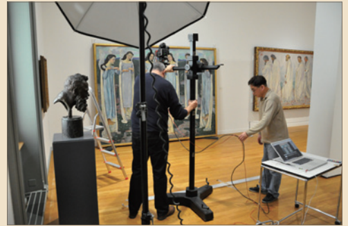
Take a photograph of the original picture at Kunstmuseum, Bern. ベルン美術館にて原画を撮影。