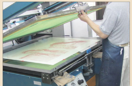
Print an original image on a transfer paper. 転写紙に絵を印刷する。