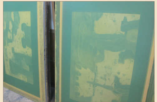
Make a plate of silk screen for printing of transfer paper. 転写紙を印刷するための版をつくる。