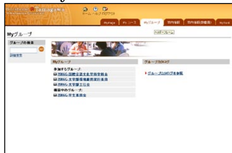
(b) My グループ：

授業のコースは、このタブに集約されます。自分の指導中のコース・参加中のコース一覧が表示されます。