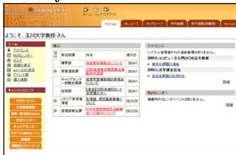
(a) My コース：

授業のコースは、このタブに集約されます。自分の指導中のコース・参加中のコース一覧が表示されます。