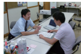
図6. IT サポートデスク案内図・サポート風景