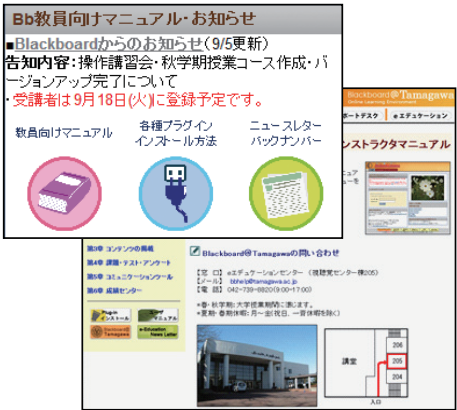
図4. Bb マニュアルページ

http://wm.tamagawa.ac.jp/manual/Bb/inst/learn_jp/index.htm