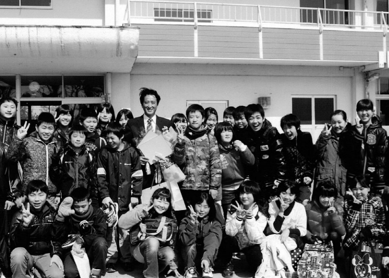
7年間勤務した登米市立南方小学校の離任式。教え子の卒業生たちが集まって、送り出してくれた

中学時代から、小学校の先生になるうと思っていたんです。子どもたちに教えるのが向いているんじゃないかと言われて、うん、そうかなと（笑）。