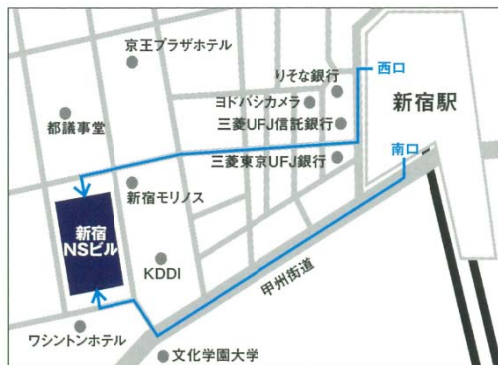
JR 新宿駅（南口・西口）より徒歩7分