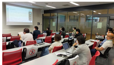
修士論文構想発表会

教育研究をとおして、幅広い教養、コミュニケーション能力、論理的思考力を培うとともに、教育実践の諸課題を発見し、その課題の本質を追究し、問題解決へと導く力を培います。