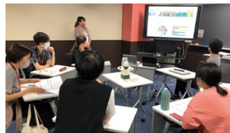
授業における対話的な学び