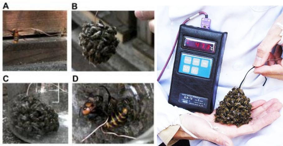
図 1: 熱殺蜂球の人為的成形

通常、熱殺蜂球は巣内で形成される。今回我々は、蜂球を形成している働き蜂を継時的に採集するため、針金の先に罌のオオスズメバチを取り付け、巣内に挿入し(A)、形成された蜂球をビーカーに隔離して(B, C)、働き蜂を採集した。ビーカー内は蜂球から発生した水蒸気で曇っている。蜂球中のオオスズメバチは 60 分後には完全に死亡していた(D)。補足写真 a(右): 熱殺蜂球内の温度モニター(47.3°Cに達している)、手のひらに載せても刺針行動は起きない。