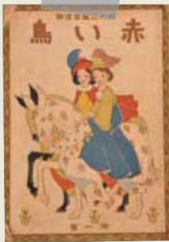
「赤い鳥」創刊号(大正7年)