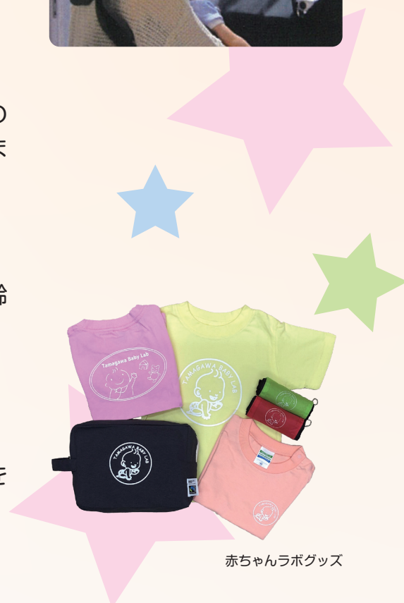
赤ちゃんラボグッズ