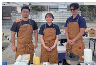
● 地域の方々との交流