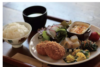
● 農園カフェ「つくる」ごはん定食